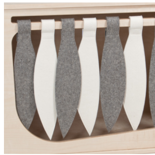
NAT beige / braunmeliert

Bitte geben Sie die gewünschte Bezeichnung an!