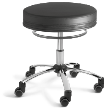
485.000.003K Sanus®-Hocker mit Kunstlederbezug Sitzhöhe 35 – 41 cm Sitzhöhe 41 – 49 cm Sitzhöhe 45 – 53 cm

Polstersitz aus Kunstleder mit hochwertigem Sitzkern (Ø 38 cm) und 5 Rollen. In den Farben rot, beige, schwarz und orange erhältlich.