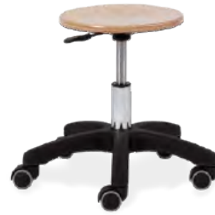
485.000.001 Hocker mit Holzsitz Ø 30,5 cm Sitzhöhe 34 – 42 cm

Polstersitz aus Kunstleder mit hochwertigem Sitzkern (Ø 38 cm) und 5 Rollen. In den Farben rot, beige, schwarz und orange erhältlich.